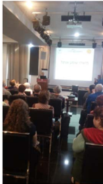
עמותת פרקינסון ישראל